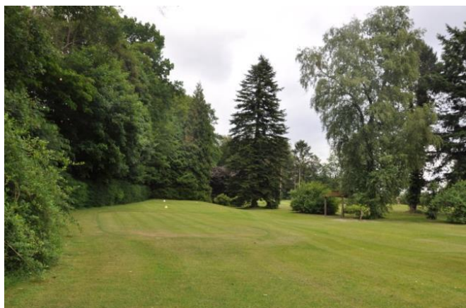
« Au départ du 13, le sapin de Nordmann et le bouleau pubescent aujourd'hui disparu »

A gauche du back tee Messieurs, un très beau sapin de Nordmann ( Abies nordmanniana ). Près de l'abri, il y avait un bouleau pubescent ( Betula pubescens ) (*) qui est tombé au cours de l'hiver 2012 – 2013. Nous l'avons remplacé par un Acer 'Drummondii' comme au 4. Un peu plus loin vers le petit parcours des beaux petits sapins un peu brillants. Ce sont des sapins d'Espagne ( Abies pinsapo ).