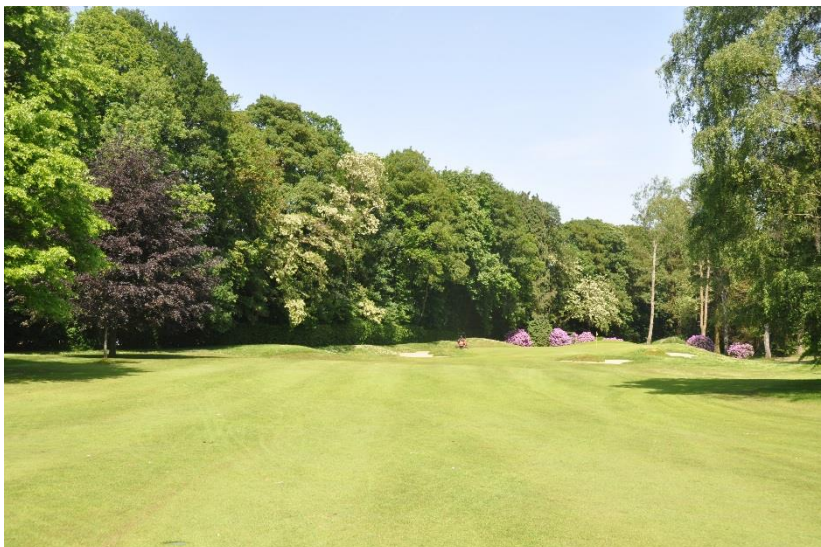
« Les rhododendrons et les acacias derrière le green du 14 après la chute du chêne et avant la plantation des 'Fall Fiesta' »