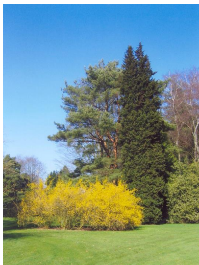
« Le pin sylvestre vu du 11 »