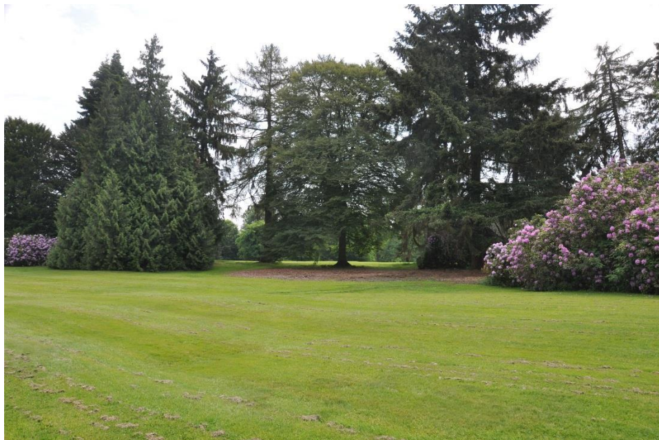
« L'asplenifolia' et le mélèze dans la percée à droite du 4 »

Il faut admirer au passage le petit marronnier indien à fleurs rouges qui a été planté en 1998 à gauche du fairway, à hauteur du piquet des 150 m. C'est un Aesculus carnea 'Baumanii'. Ce dernier résiste bien à la maladie du marronnier, ce qui n'est malheureusement pas le cas des grands marronniers qui sont à l'arrière-plan.