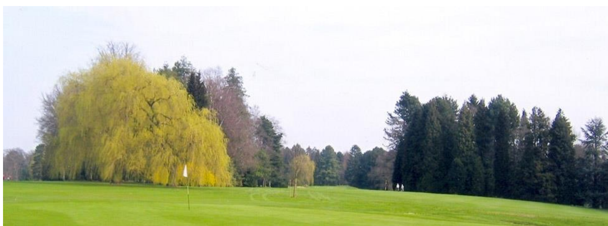
« Vue du départ du 14 vers le fairway du 11 »

Plus loin à gauche, vers le green du 13, nous avons planté un chêne pédonculé ( Quercus robur ). Nous lui avons laissé suffisamment d'espace pour qu'il devienne beau comme les chênes du 5 et du 14. Nous avons aussi planté un petit liquidambar près de la fontaine et un chêne écarlate ( Quercus coccinea ) qui n'était pas encore sur nos parcours.