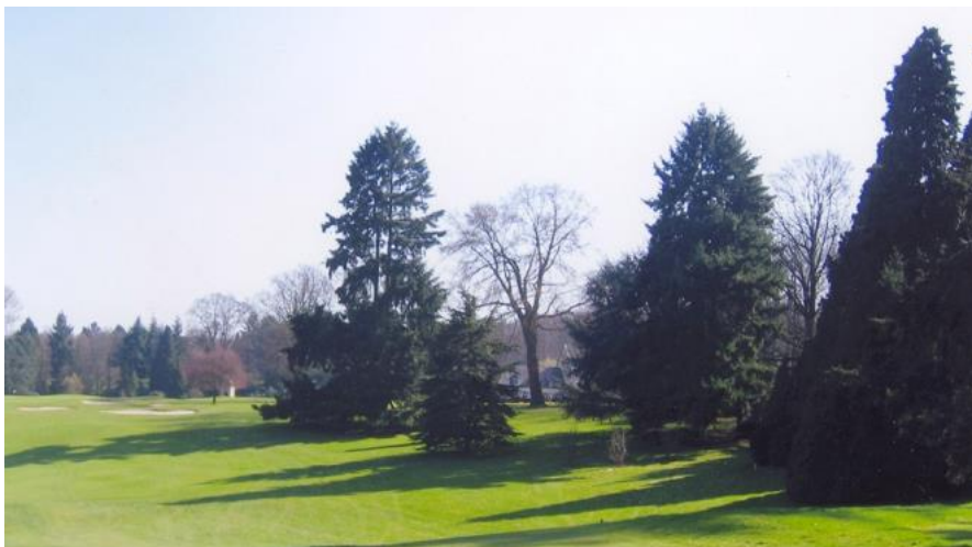
« A droite du 18 : l'érable argenté champion de Belgique entre deux Douglas. A droite, un beau Chamaecyparis lawsoniana »

Il faut noter une belle vue vers le château qui était cachée antérieurement par le noyer du practice green. Dans la même direction, on retrouve le bel érable argenté champion avec, de part et d'autre, deux grands Douglas ( Pseudotsuga menziesii ). Le grand Douglas en bordure du fairway à une branche basse très photogénique que nous « aidons » depuis une quinzaine d'années. Devant ce grand Douglas, un cèdre de l'Atlas ( Cedrus atlantica ).