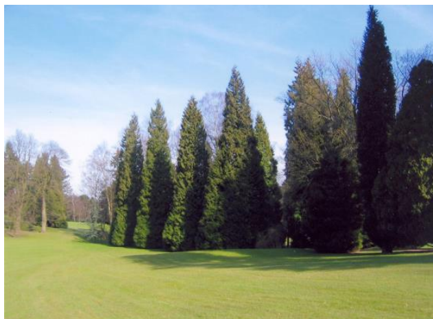
« La colonnade de Thuja plicata au 10 »

Juste devant le green, un grand marronnier très important sur le plan golfique. Cet arbre est heureusement protégé par un châtaignier avec qui il fait bon ménage depuis longtemps. Un jeune châtaignier ( Castanea sativa ) a été planté devant le marronnier pour le remplacer un jour. Nous avons coupé quelques branches du marronnier et du grand châtaignier pour donner priorité au petit châtaignier.