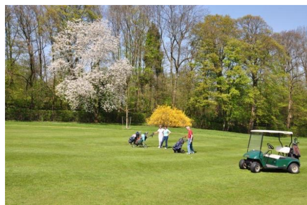
« Les merisiers à droite du 17 sont très beaux au printemps »