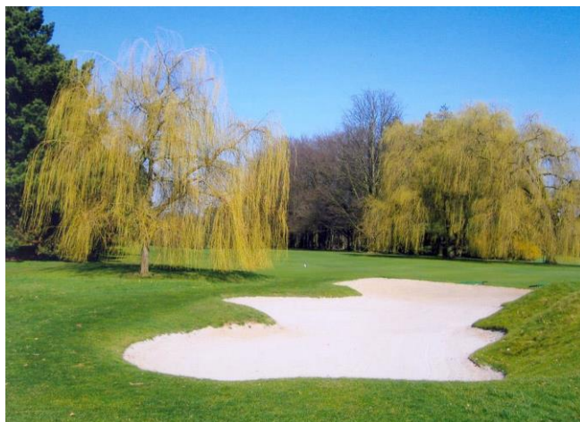
« Les saules du green du 13 prennent leurs premières couleurs (mars 2005) »