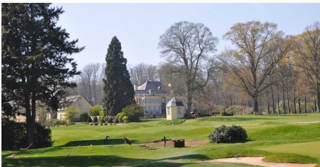
« La belle vue sur le château qu'on a maintenant après la chute des deux Chamaecyparis à gauche des départs du 3 »

Derrière votre adversaire qui prend son départ au départ Messieurs, vous trouvez un beau platane commun ( Platanus hispanica ) que vous avez déjà probablement remarqué en passant au 2.