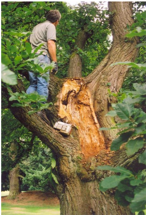
« On ne voit plus aujourd'hui la terrible blessure du châtaignier du green du 13 »

Certains ont voulu le couper mais nous l'avons gardé. Nous l'avons taillé. Nous avons privilégié certains rejets. On ne voit plus la blessure. Cet arbre a retrouvé une silhouette tout à fait harmonieuse.