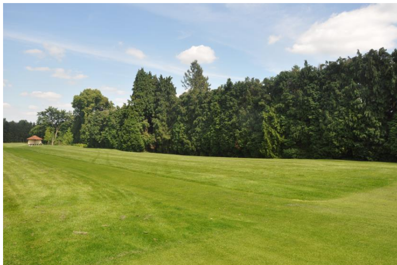
« Les Chamæcyparis qui cachaient jusqu'en 2013 le beau jardin de Monsieur Solvay »