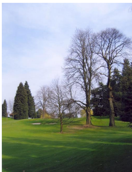
« Le châtaignier qui devra remplacer un jour le marronnier du green du 10 »

Pour permettre un meilleur séchage du green, nous avons été amenés à couper cinq résineux derrière le green, ce qui nous a donné une belle percée vers le 11. Nous avons dû aussi malheureusement étêter et raccourcir le beau massif de thuyas à droite du green. Nous avons même coupé une partie de ce massif pour faciliter le séchage du green ce qui nous a permis de créer une belle ouverture vers les fairways avoisinants.