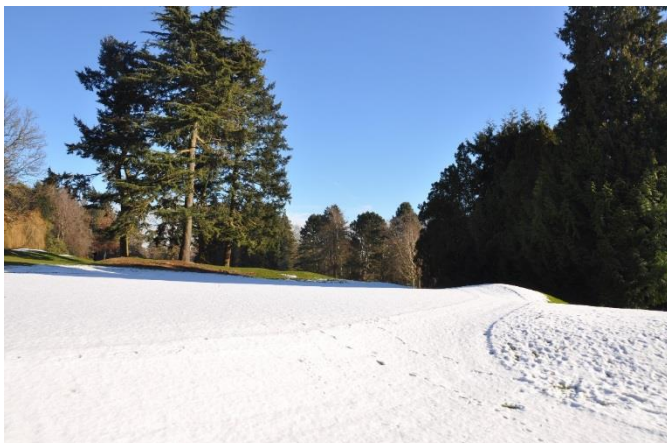
« La percée du green du 10 vers le fairway du 11 »