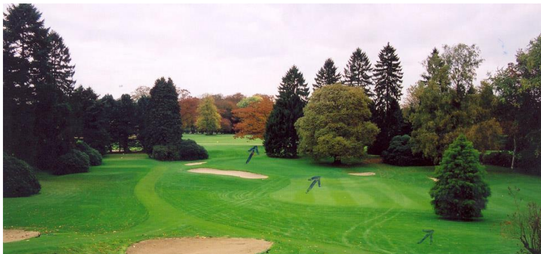
« Vue du green du 3, de droite à gauche : le Taxodium , le châtaignier du green du 2 et le chêne d'Amérique du green du 9 aujourd'hui disparu. Sur cette photo, les pins noirs derrière les départs du 3 n'ont pas encore été coupés et les Chamaecyparis à gauche des départs ne sont pas encore tombés »