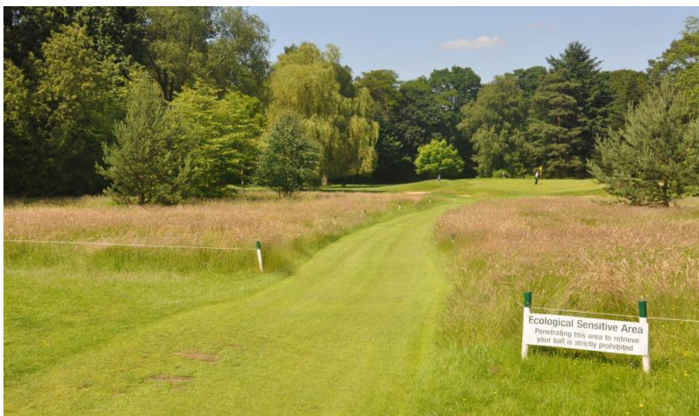
« La zone nature du 12 »

Plus tard, nous avons coupé les pins sylvestres pour élargir à nouveau la vue vers le green.