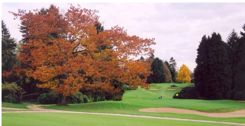
« Le chêne d'Amérique du 9 aujourd'hui disparu »

A la gloriette, on découvre au-delà du 9 un admirable massif d'ifs ( Taxus baccata ) verts et jaunes et de Tsuga du Canada ( Tsuga canadensis ) dominés par un épicéa aux rameaux pleureurs ( Picea abies 'Viminalis' ) (**).