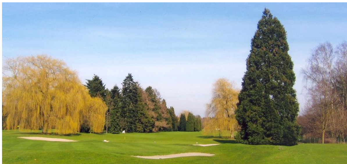
« Le wellingtonia du green du 5 vu du départ du 6. Aujourd'hui, nous avons coupé les branches basses de l'arbre pour dégager son tronc prestigieux »

A gauche du green, un wellingtonia ( Sequoiadendron giganteum ) qui a été planté par le Comte Gatien du Parc et qui a déjà une belle prestance. A la gauche du wellingtonia se trouvait un cèdre bleu de l'Atlas ( Cedrus atlantica 'Glauca') étêté qui empiétait dans l'espace du wellingtonia. Nous l'avons coupé. Nous n'avons rien planté à cet endroit parce que la vue est très belle vers le verger et les frondaisons de la forêt de Soignes.