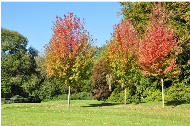
« Les Acer freemanii devant le green du 17 peu après leur plantation »

Derrière le green, il y avait un très beau merisier des bois ( Prunus avium ). C'était un champion dont certains se souviennent peut-être. Il a été emporté par la tempête et nous l'avons remplacé par un liquidambar ( Liquidambar styraciflua ). La disparition du merisier a mis en évidence un grand frêne à feuilles étroites ( Fraxinus angustifolia ) qui était derrière le champion et qui pourrait lui-même devenir un champion.