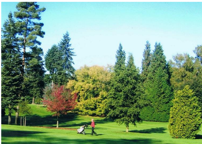
« Derrière la joueuse, l' Acer negundo du 1. Devant elle, l' Abies concolor à droite du 2 »

A droite, un superbe sapin de Vancouver ( Abies grandis ) qui était flanqué d'un pin arolle ( Pinus cembra ) qui est l'arbre de nos stations de sports d'hiver et un petit Chamæcyparis . Le pin arolle est malheureusement mort et nous l'avons remplacé par une jeune plante en 2015.