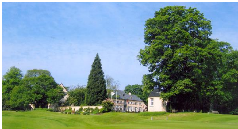
« Les vieux châtaigniers, le bébé séquoia et le sycomore de la gloriette »

A droite et à côté de la gloriette, un érable sycomore ( Acer pseudoplatanus ). Cet arbre a à la fourche un chancre profond d'un mètre qui le fragilise malheureusement. Nous avons soigneusement nettoyé et drainé cette blessure. Nous avons câblé ses branches supérieures pour l'aider à lutter contre les tempêtes. Je conseille de vérifier régulièrement la présence de ces câbles indispensable. Nous ne pouvons malheureusement pas l'empêcher de fragiliser la gloriette que nous devons réparer régulièrement.