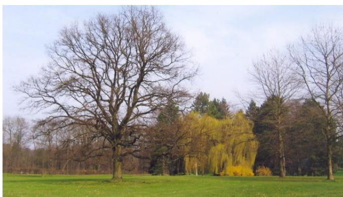
« Le Quercus robur du 14 en hiver »

A gauche, nous avons encore dû couper un grand hêtre que nous avons remplacé par un noyer de Chine ( Pterocaria stenoptera ) et un frêne blanc ( Fraxinus americana ) qui a une très belle coloration automnale qui varie du jaune au brun.