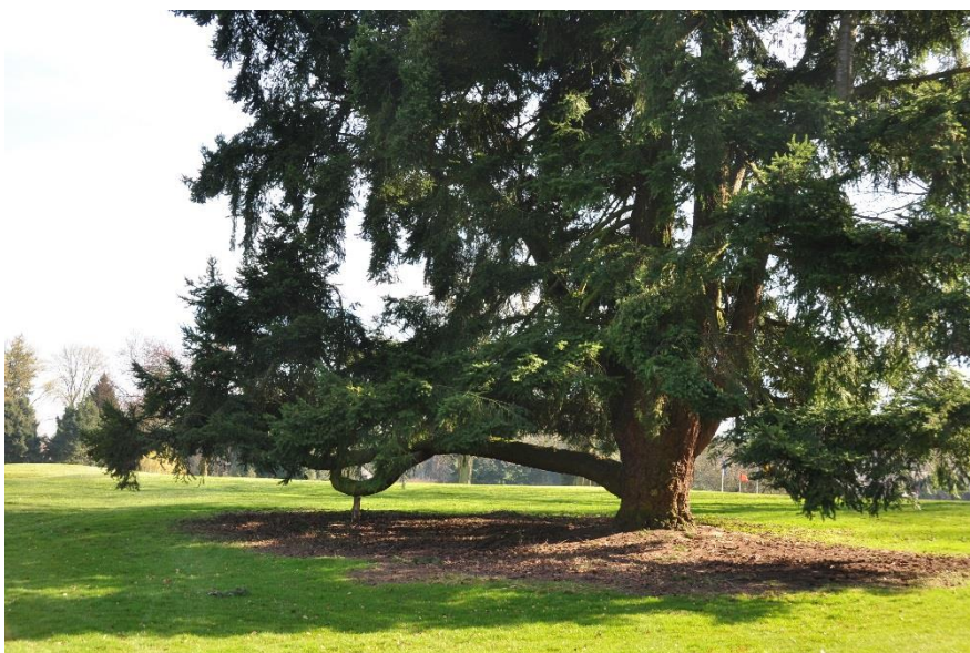
« Le grand Douglas du 18 et son support »

Beaucoup de « semper virens » dans ce coin que j'ai voulu égayer en plantant cinq parroties de Perse en cépée ( Parrotia persica ).