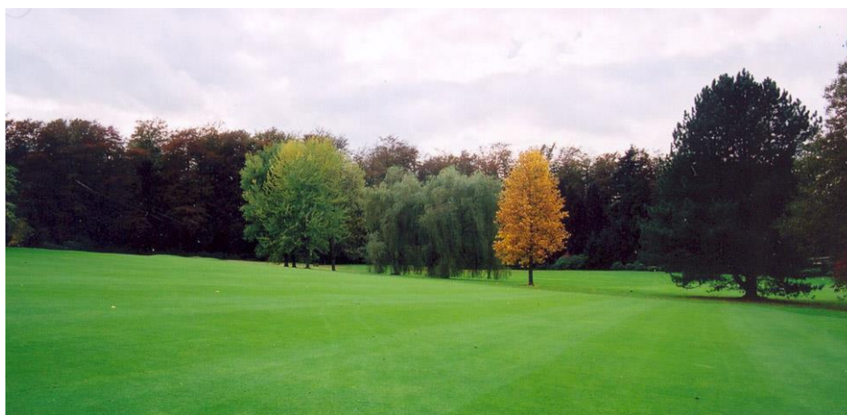
« De gauche à droite, les quatre érables argentés, les trois saules pleureurs, un tulipier et un pin noir photographiés il y a plus de 10 ans »

A droite du tulipier, un pin noir ( Pinus nigra ) isolé. Un peu plus loin, il y avait deux châtaigniers ( Castanea sativa ). Philippe de Spoelberch nous conseillait depuis longtemps de couper un des deux châtaigniers si nous voulions avoir à cet endroit un bel arbre au lieu de deux demis arbres. Nous n'avons pas encore eu le courage de couper un des deux arbres. Ils se sont mis d'accord entre eux : celui qui est vers le 9 est tombé malade récemment et nous l'avons coupé.