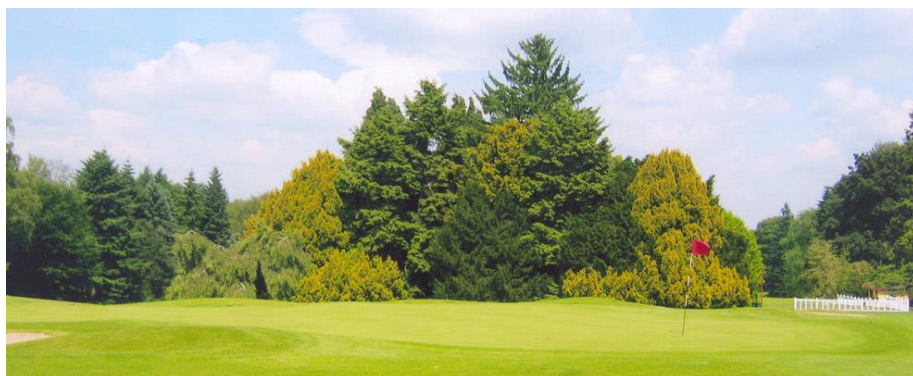
« Le beau massif d'ifs et de Tsuga à gauche du green du 18 »

En quittant la grange vers le départ du 1, vous admirerez au passage nos deux beaux vieux châtaigniers ( Castanea sativa ). Leurs vieux troncs sont de véritables sculptures. Plus loin à gauche, vous trouverez un wellingtonia ( Sequoiadendron giganteum ). C'est un bébé. A maturité, cet arbre peut monter jusqu'à 50 m ou même davantage.