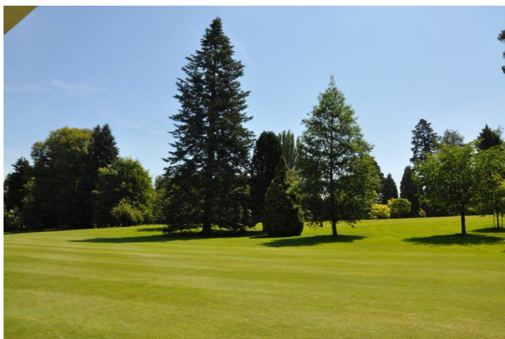
« L' Abies grandis , le pin arolle et le petit Chamæcyparis à droite du 1 avant la disparition du pin »

Avant et après l' Abies grandis , un érable argenté aux feuilles plus découpées ( Acer saccharinum f. laciniatum ) et un érable argenté ( Acer saccharinum ). Le premier est en face du negundo , le second au piquet des 150.