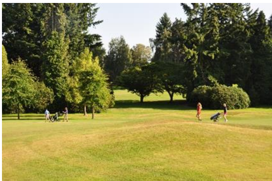
« La nouvelle percée vers le 8 qui a été élargie récemment pour planter deux petits Ozakazuki »