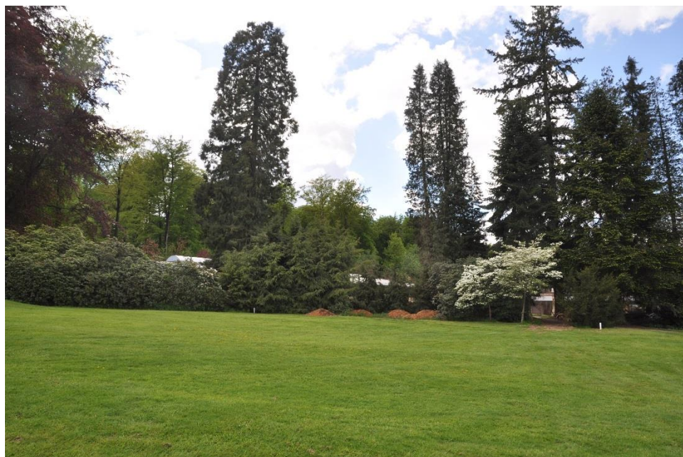
« La vue à gauche du 9 vers le nouveau hangar »

Nous avons planté les mêmes Tsuga à droite du wellingtonia pour cacher les constructions à l'arrière-plan.