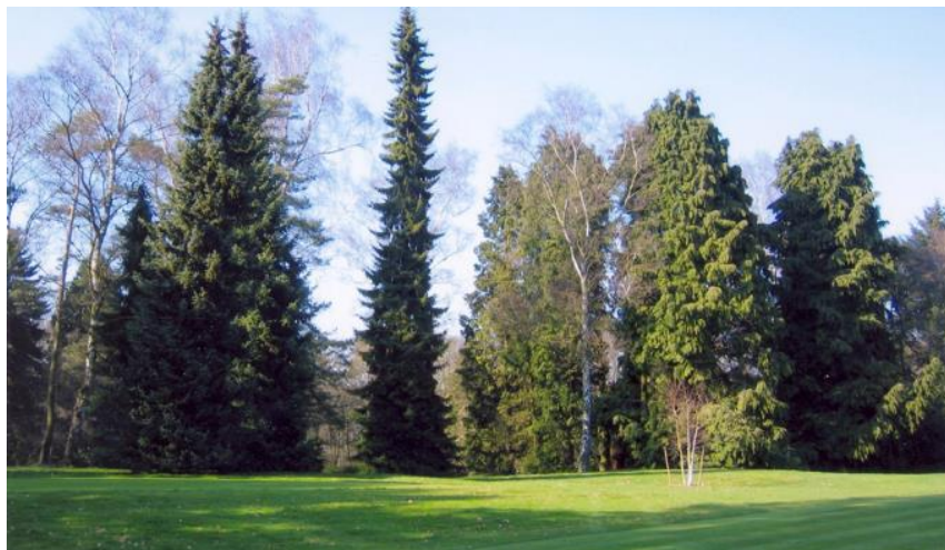
« Le plus beau Picea omorika du parcours à gauche du départ du 12 »

Nous avons complété le travail. Nous avons ajouté deux pins sylvestres ( Pinus sylvestris ), trois bouleaux noirs ( Betula nigra ), un bouleau de l'Himalaya ( Betula utilis ) dont l'écorce est particulièrement blanche et un févier doré ( Gleditsia triachantos inermis 'Sunburst') comme celui du 9.