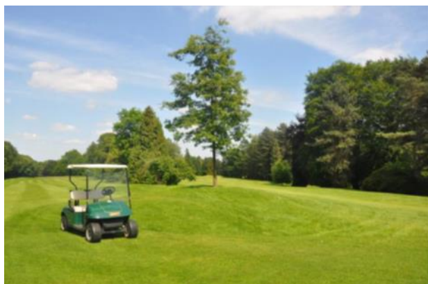
« Entre le 15 et le 16 : le chêne imbriqué très heureux sur sa butte »

De l'autre côté du fairway, à la baïonnette de la clôture, on a planté trois liquidambars qui constituent un bel ensemble. Un des liquidambars a perdu la tête récemment, comme au 7. Nous leur avons donné plus d'espace en coupant des mauvais résineux vers l'arrière. Nous avons aussi ajouté trois merisiers pour assurer une belle tache de couleur au printemps. Juste avant les liquidambars, on peut voir un tilleul à petites feuilles ( Tilia cordata ).