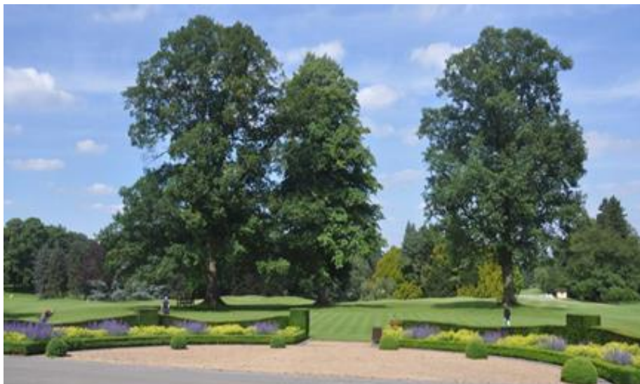
« Le tilleul (au milieu) et les deux chênes d'Amérique »

Le chêne à gauche est malheureusement à la fin de sa vie. Il a perdu récemment une grosse branche ce qui risque de le déséquilibrer. Quant au chêne de droite, nous avons dû couper en tranchée ses racines qui menaçaient le practice green mais il se porte bien.