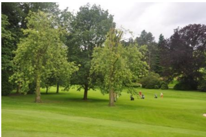
« Le chêne de Hongrie entre les deux petits érables argentés »

Si vous vous retournez, vous verrez la belle vue vers le château qui a été longtemps cachée par un marronnier au départ du 1. En avançant vers le green, vous ne pouvez pas manquer à gauche le grand hêtre pourpre ( Fagus sylvatica f. purpurea ) et juste avant le green, à droite, un chêne de Hongrie ( Quercus frainetto ) et deux petits érables argentés qui ont souffert de la grande tempête d'août 2011 mais qui ont été bien élagués.