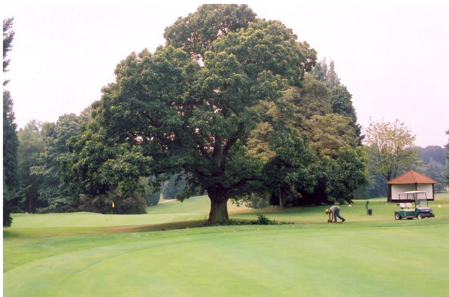
« Le châtaignier du green du 13 en cours d'élagage »