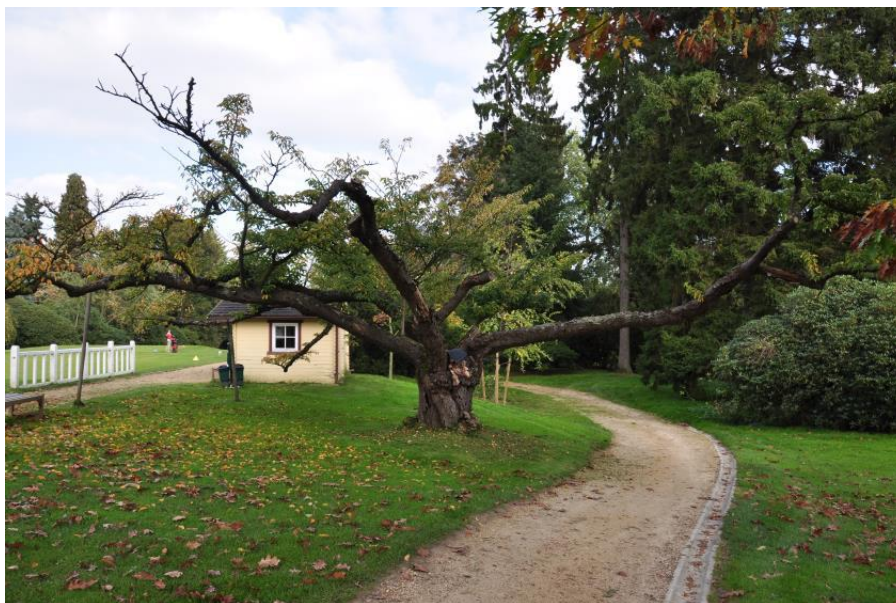
« Pour les nostalgiques du vieux prunus du 1 »

Tous nos anciens membres se souviennent du vieux prunus ( Prunus 'Kanzan Sekyama') (*) au départ du 1. Nous avons essayé de prolonger sa vie en l'élaguant, en le protégeant des infiltrations et en le nourrissant. Finalement, nous l'avons coupé pour donner la place à la nouvelle buvette.