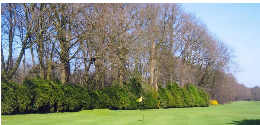
« La haie de Chamaecyparis au green du 15 »