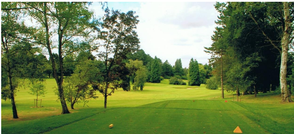
« La belle vue du nouveau départ du 9 »