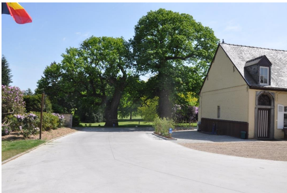
« Nos châtaigniers plusieurs fois centenaires »

Plus loin, tout est changé. Avant, on tournait à droite et on passait devant la terrasse pour accéder au parking. Maintenant, on continue tout droit, en façade nord du château, pour se trouver face à nos deux beaux châtaigniers plusieurs fois centenaires et donc bien antérieurs à la création du golf. Ils ont miraculeusement survécu aux tempêtes et aux orages.