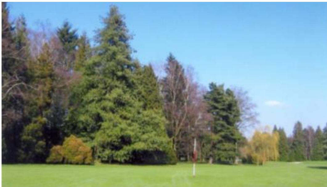
« Le pin pleureur de l'Himalaya champion de Belgique dans toute sa splendeur »

Juste à côté, un beau Chamaecyparis ( Chamaecyparis pisifera 'Plumosa Aurea'). Derrière le green du 11, il y avait un autre pin pleureur de l'Himalaya ( Pinus wallichiana ) (●) qui a été littéralement soufflé par la dernière tempête. Nous ne l'avons pas remplacé pour laisser une ouverture vers le petit parcours.