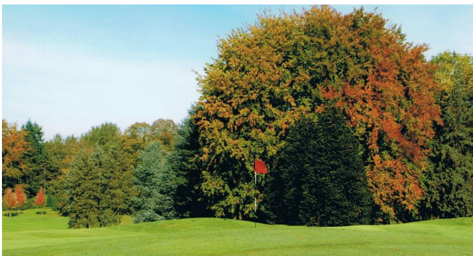
« Les araucarias du 10 devant le beau massif de hêtres avant la tempête de 2011. Au fond, à gauche, les érables freemanii du 17 »