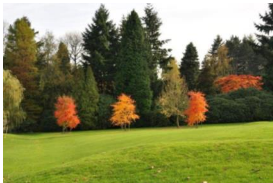
« Les Nyssa sylvatica du 9. A l'arrière-plan, les érables Ozakazuki du 8 »