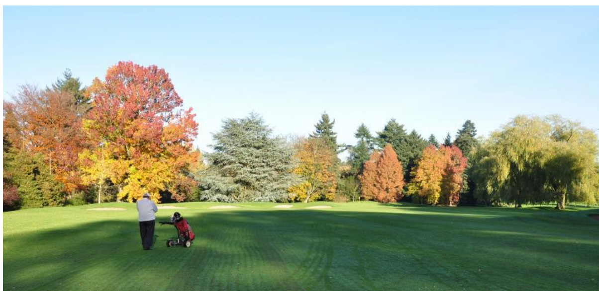
« Vue du 7 avec, de gauche à droite, le grand liquidambar du 8, le cèdre bleu, le sycomore, les métaséquoias et les liquidambars »

Derrière le green, il y a à gauche un érable puis trois métaséquoias, puis vers la droite trois liquidambars, un érable rouge et un érable jaune qui ont été plantés trop près l'un de l'autre. Philippe de Spoelberch nous avait conseillé de couper deux des trois liquidambars. Nous n'avons pas suivi son conseil. Aujourd'hui, c'est trop tard : le plus beau des trois liquidambars a été étêté par le vent et il me paraît préférable de les laisser continuer leur vie ensemble.