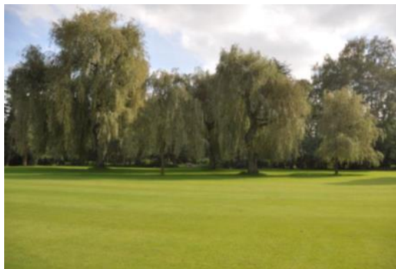
« Les saules du 5 juste après l'élagage ...»