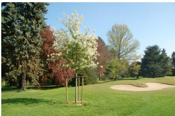
« Le cerisier de Mandchourie du 7 »