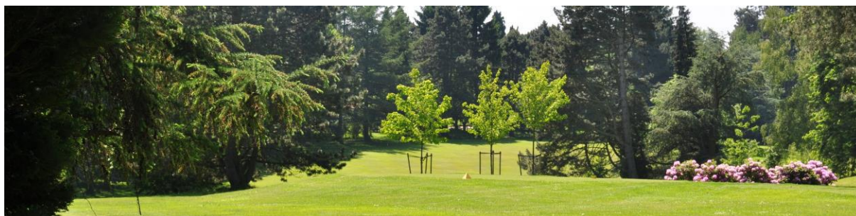
« Les érables 'October Glory' derrière le départ du 3 »

Derrière le départ et pour le protéger d'un second coup slicé au 8, nous avons planté trois érables 'October Glory' qui, comme leur nom l'indique, sont tout à fait somptueux en automne. A droite du départ, nous avons planté un petit massif de rhododendrons.