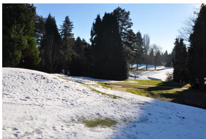
« La belle ouverture à droite du green du 10 vers les fairways avoisinants »