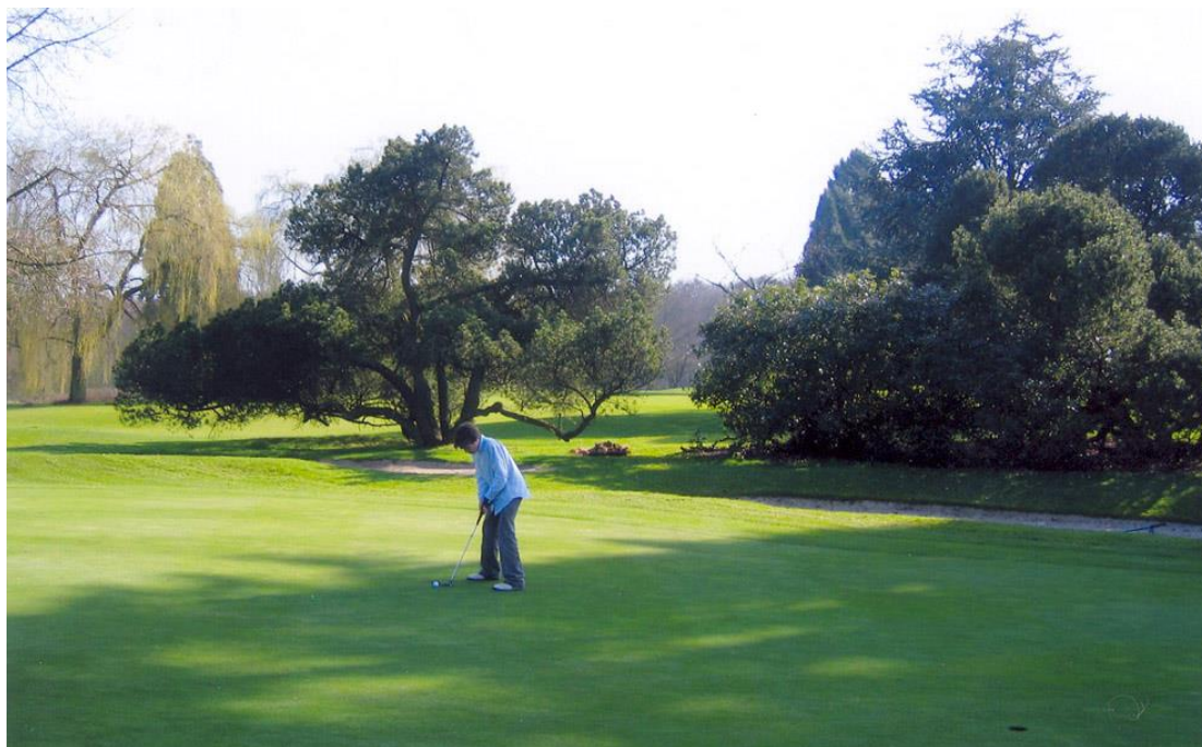
« Le Pinus mugo champion de Belgique au green du 3 aujourd'hui disparu »

A droite du green du 3, nous avons considérablement diminué l'importance des rhododendrons pour mettre en valeur les pins à crochets ( Pinus mugo ) mais le beau pin mugo champion de Belgique est malheureusement mort il y a trois ou quatre ans. Nous n'allons pas le remplacer pour pouvoir éventuellement reculer les départs du 8.