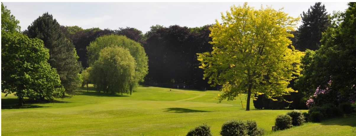
« Le même Gleditsia vu à contre-jour »

De l'autre côté du fairway, juste avant les rhododendrons, nous avons un pin de Murray ( Pinus contorta ) (*) qui a été méchamment abîmé par une tempête il y a plus de quinze ans. Nous avons planté aussitôt un petit pin de Murray juste à côté pour le remplacer. Dernièrement, nous avons dû tailler un rhododendron pour lui donner plus d'espace.