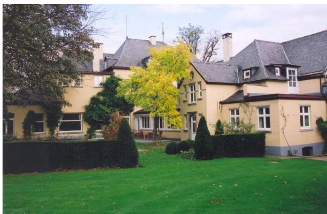
« Le faux acacia 'Frisia' de la terrasse, aujourd'hui disparu »

Dernière précision : le grand parcours s'appelle dorénavant « l'Arboretum » et le petit parcours « le Parc ».