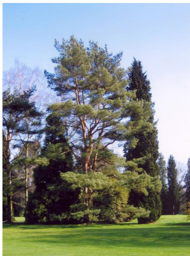
« Le pin sylvestre vu du 13 »