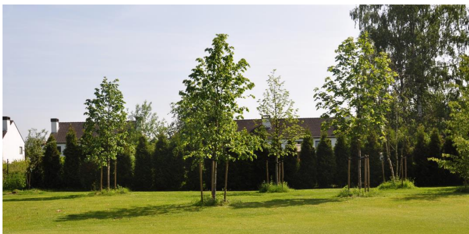
« Les feuillus et les Thuja devraient cacher progressivement les maisons voisines »

Le fairway a été complètement réorienté à cause du déplacement vers la gauche du green du 5 : pratiquement tous les épicéas et les pins noirs le long de la clôture et à gauche du fairway ont été coupés. Ils cachaient le ciel et leurs troncs dénudés ne cachaient plus les maisons voisines. Ils ont été remplacés par des feuillus indigènes (tilleuls, érables, bouleaux, charmes, amélanchiers, aulnes, hêtres, merisiers). Une haie de Thuja occidentalis 'Brabant' et lauriers a été plantée en trois fois pour cacher les clapiers et autres débris de fonds de jardins de nos voisins.