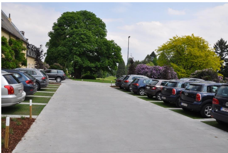
« Les deux châtaigniers et le Gledisia »

En revenant vers la cour du château, on retrouve les deux châtaigniers et à droite notre superbe Gleditsia ( Gleditsia triachantos inermis 'Sunburst') qu'on retrouvera plus tard à gauche du fairway du 9.