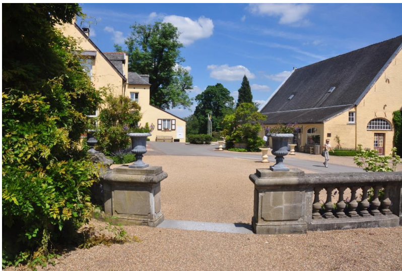
« La cour du château »

La cour du château doit encore être aménagée. Au milieu de la cour, il y avait un beau frêne pleureur ( Fraxinus excelsior Pendula ) (*) aujourd'hui disparu. Comme le grand frêne en façade nord du château également disparu. Ce sera d'ailleurs malheureusement le sort de tous nos frênes indigènes. Le beau puits prend maintenant toute sa valeur.