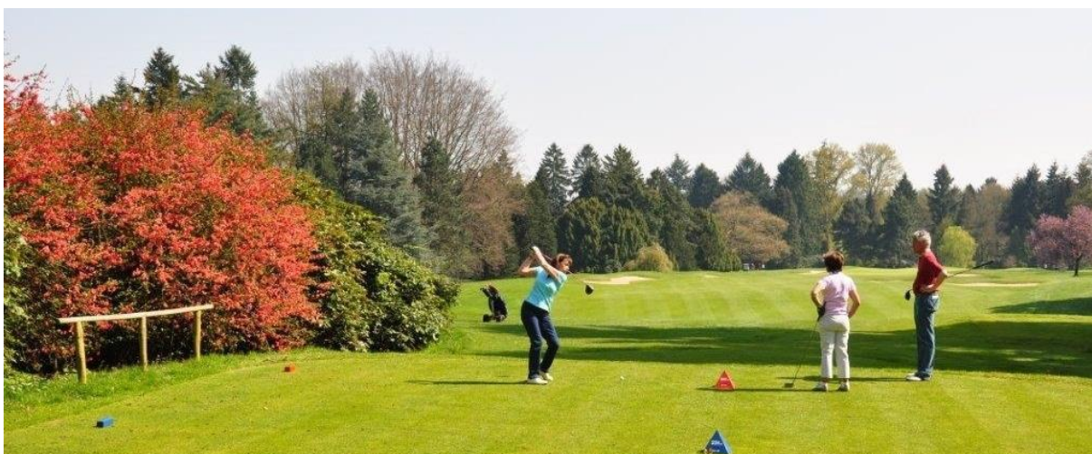
« Les cognassiers du Japon au départ du 18 »

La belle vue au départ du 18 avec à gauche les cognassiers du Japon joliment colorés au printemps.