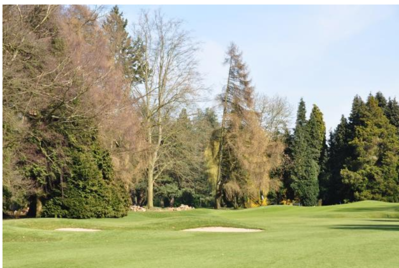
« Le mélèze qui était derrière le green du 16 »

A droite du green, les petits chênes sont des chênes chevelus ( Quercus cerris ).