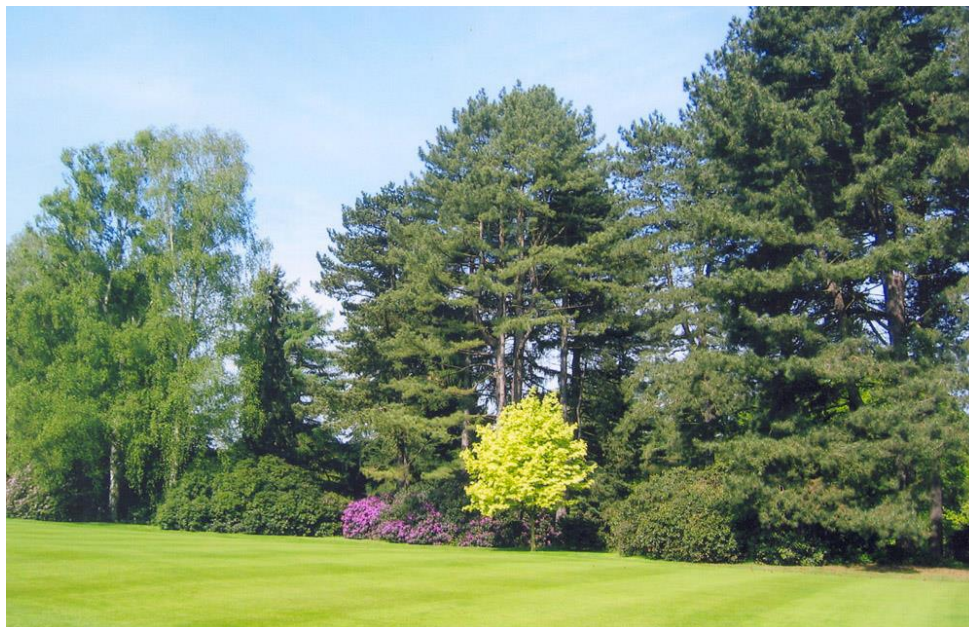
« Le petit érable à gauche devant le green du 4 a bien grandi depuis cette photo »

Juste avant le green, à gauche, il y a un curieux petit arbre jaune qui a été planté il y a quelques années. C'est un cultivar qui n'a peut-être pas tout à fait sa place à cet endroit mais nous avons décidé de le garder. Il avait un air penché. Nous coupons régulièrement quelques branches des pins noirs qui le surplombent pour lui permettre de vivre normalement sa vie. Il s'agit d'un érable plane à feuilles panachées ( Acer platanoides 'Drummondii'). C'est peut-être l'arbre dont on me parle le plus souvent mais ce n'est certainement pas mon préféré.