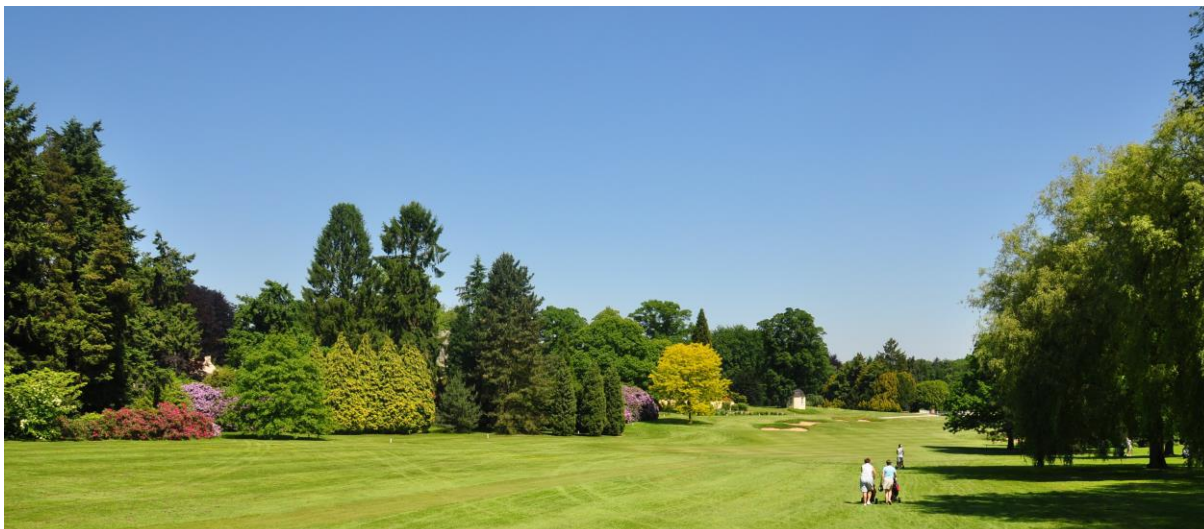
« La belle vue du départ du 9 avec de gauche à droite, les rhododendrons rouges et mauves, le chêne des marais et les Chamaecyparis jaunes, les genévriers et le Gleditsia »