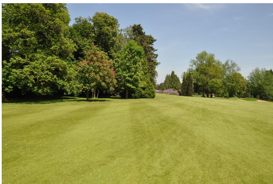
« Le petit marronnier indien à fleurs rouges »

Il faut admirer au passage le petit marronnier indien à fleurs rouges qui a été planté en 1998 à gauche du fairway, à hauteur du piquet des 150 m. C'est un Aesculus carnea 'Baumanii'. Ce dernier résiste bien à la maladie du marronnier, ce qui n'est malheureusement pas le cas des grands marronniers qui sont à l'arrière-plan.