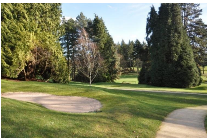
« La nouvelle percée à droite des départs Dames du 11 »