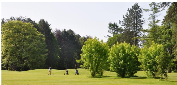
« Les érables argentés 'Pyramidalis' devant le green du 5 »

Devant le green du 5, nous avons planté cinq érables argentés ( Acer saccharinum 'Pyramidalis') un bouleau verruqueux ( Betula pendula ) et un mélèze d'Europe ( Larix decidua ) qui ont fait très rapidement un bon écran pour protéger le green du 5 d'un mauvais coup slicé au 4.