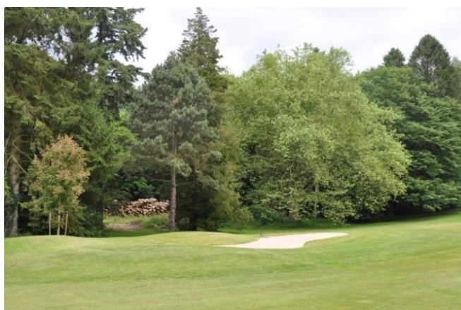
« Le beau platane du 13. A droite, un très beau charme. A gauche, un petit érable negundo comme le champion du 1 »

Juste après le platane, un Chamæcyparis champion » ( Chamæcyparis pisifera 'Plumosa') (**).