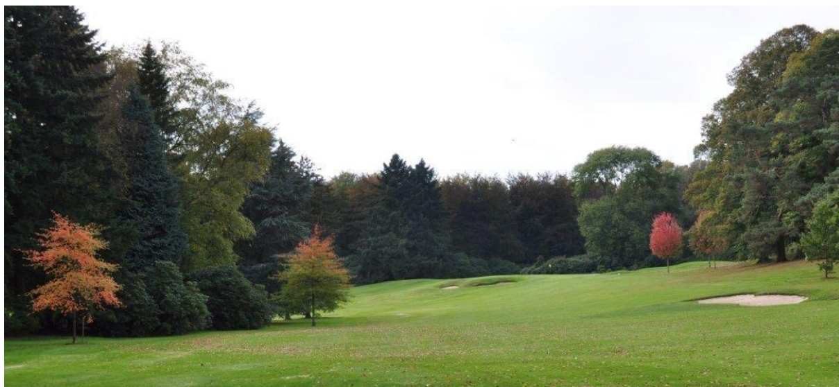
« Le Nyssa sylvatica et le chêne des marais à gauche du 17 »

En bordure du bois, vers la gauche, nous avons planté un tupélo noir ( Nyssa sylvatica ) et un chêne des marais ( Quercus palustris ) qui l'un et l'autre prennent une belle coloration en automne. Ce sont des arbres qui aiment le soleil et l'humidité. Ils devraient être parfaitement heureux à cet endroit.