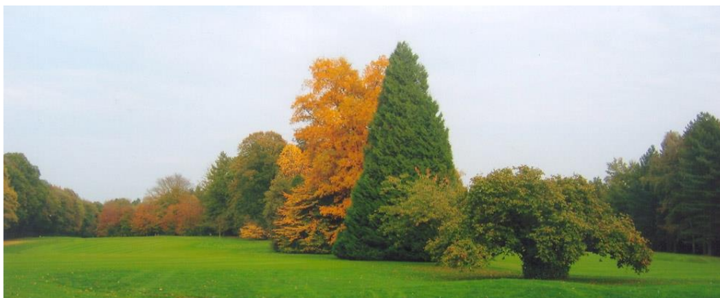
« L'hickory, le Thuja plicata et le noisetier entre le 15 et le 16 »

Juste après le boqueteau, un très beau Thuja plicata et un noisetier.