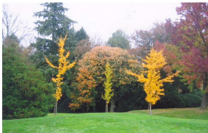
« L'alisier champion qui était derrière les Ginkgo biloba »