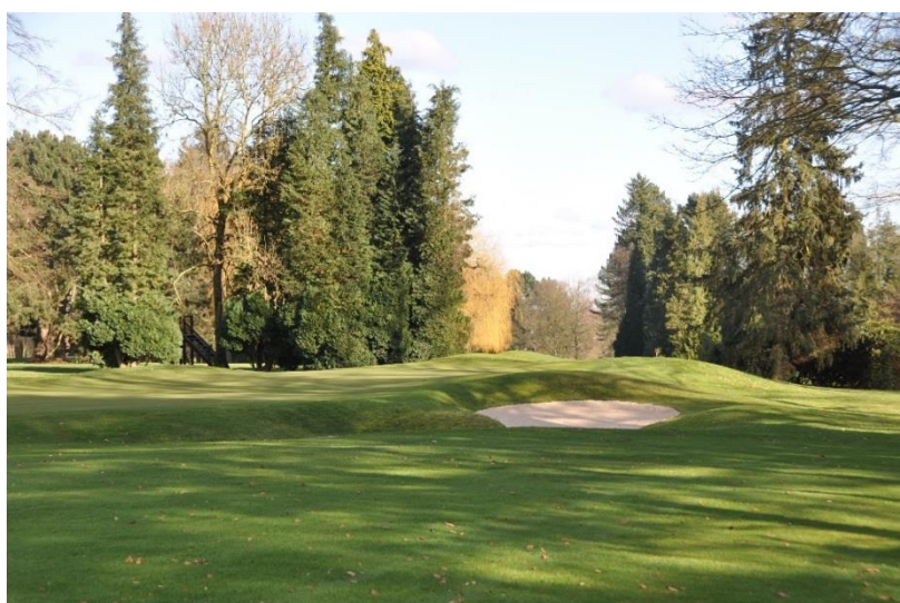
« La nouvelle percée derrière le green du 16 »