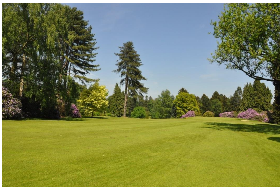
« Le Douglas qui faisait partie du petit bois entre le green du 1 et le green du 4 »

Cet hiver, nous avons coupé, comme l'hiver précédent, une soixantaine de grands arbres pour faciliter le séchage du terrain. C'était une obligation technique mais nous avons tous été surpris de trouver une réelle amélioration sur le plan esthétique. Le terrain respire mieux.