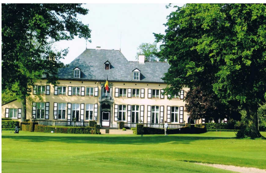
« Un château dans les arbres »

Pour répondre à toutes ces questions, j'ai pensé que je pourrais faire un résumé de tout ce qui a été fait au cours de ces vingt dernières années.