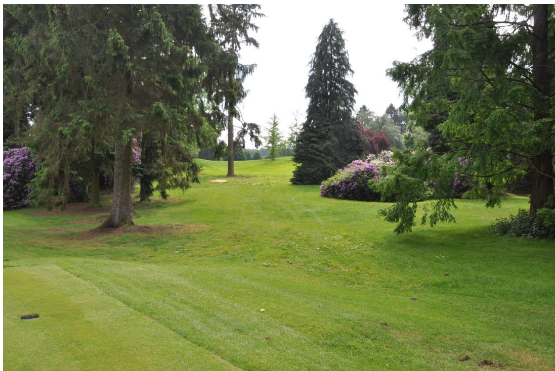
« Au-delà du bois éclairci, on aperçoit un ( Ginkgo biloba ) du 8 »

Derrière les départs, nous avons supprimé une haie de pins noirs pour ouvrir la vue dans les deux sens. A gauche des départs, il y avait deux grands Chamaecyparis malheureusement tombés dans la tempête de 2019. Nous avons décidé de ne pas les remplacer parce que la vue est maintenant plus belle encore en descendant le fairway du 9 ou à partir du 3 vers le château.